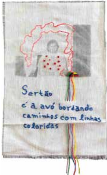
Fotografia da avó bordada

Descrição da fotografia: Tecido bordado em linhas coloridas com a estampa de uma senhora no centro da imagem. A estampa está rodeada pelo desenho de um recorte espacial do Sertão e, abaixo, no tecido, está escrita a seguinte definição: “Sertão é a avó bordando caminhos com linhas coloridas”.