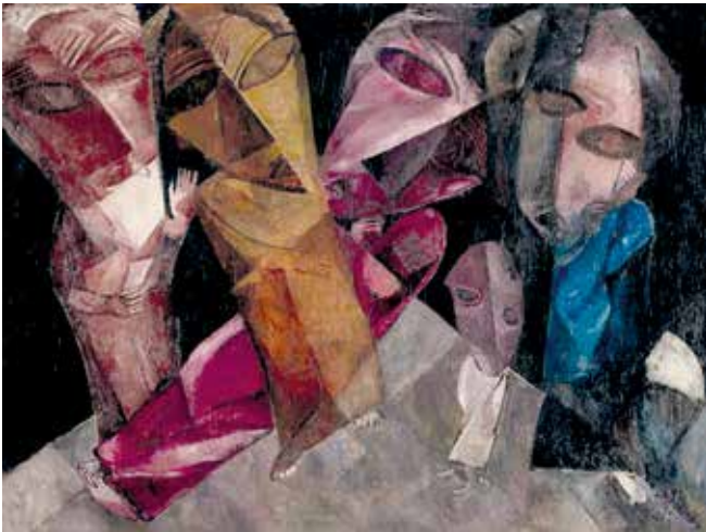
SEGALL, L. Eternos caminhantes . Óleo sobre tela, 138 x 184 cm. Museu Lasar Segall, IbramMinc, São Paulo, 1919.

Descrição da pintura: Obra em óleo sobre tela intitulada Eternos caminhantes , de Lasar Segall. Cinco figuras humanas com cabeças e olhos grandes e desproporcionais ao corpo. As imagens se entrecruzam e os rostos retorcidos têm aspectos geométricos. Uma das figuras representa uma criança.