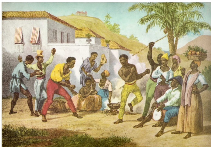
Jogar capoeira. Joahann Moritz Rugendas. Litografia colorida, c. 1835