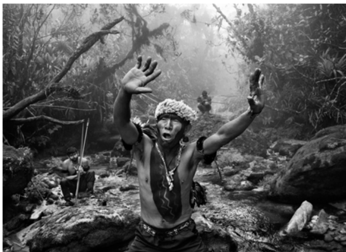
Fotografia de Sebastião Salgado (2017): Xamã Yanomami em ritual durante a subida para o Pico da Neblina, na serra do Imeri (Amazonas).

A exposição “Amazônia” do fotógrafo Sebastião Salgado no Sesc Pompeia (São Paulo, 2022) tem o objetivo de alimentar o debate sobre o futuro da floresta amazônica e das comunidades indígenas brasileiras em uma fase de aumento do desmatamento do bioma amazônico, que foi 56,6% maior entre agosto de 2018 e julho de 2021 do que entre agosto de 2015 e julho de 2018, segundo estudo do IPAM (Instituto de Pesquisa Ambiental da Amazônia).